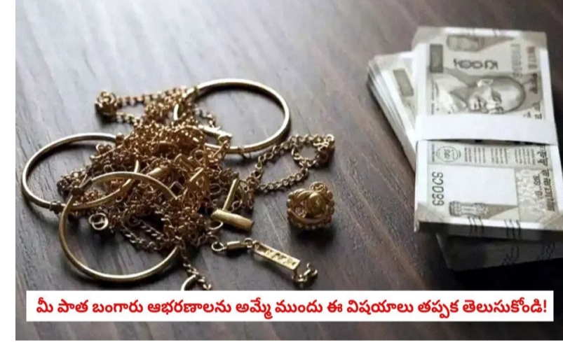
మీ పాత బంగారం ఆభరణాలను అమ్మే ముందు ఈ విషయాలు తప్పక తెలుసుకోండి!

బంగారం ధరలు ఆకాశాన్ని తాకుతున్న ఈ తరుణంలో, చాలా మంది తమ పాత బంగారాన్ని అమ్మి కొత్తవి కొనాలని ఆలోచిస్తుంటారు. అయితే, పాత బంగారాన్ని విక్రయించే సమయంలో చాలా మందికి తామె అశించిన దానికంటే తక్కువ డబ్బు వస్తుంది. దీనికి ప్రధాన కారణం నగల వ్యాపారులు, వినియోగదారుల మధ్య ఉండే లెక్కల అవగాహన రాహిత్యం. అదనపు ఛార్జీల లెక్క బంగారం కొనుగోలు చేసినప్పుడు మీరు చెల్లించిన తయారీ ఛార్జీలు ( అమ్మకం సమయంలో తిరిగి రావు. వ్యాపారులు కేవలం బంగారం బరువు స్వచ్ఛతను మాత్రమే పరిగణనలోకి తీసుకుంటారు. అమ్మకం సమయంలో మీరు చెల్లించిన అదనపు ఛార్జీలు సున్నాగా ఉంటాయి. స్వచ్ఛత పరీక్ష: మీరు 22 క్యూరెట్ల ఆభరణాన్ని కొన్నప్పటికీ, కాలక్రమేణా డిజైన్ వాడకుండా వల్ల స్వచ్ఛత మారవచ్చు. వ్యాపారులు అమ్మే ముందు దానిని పరీక్షించి, ఆ ఫలితాల ఆధారంగానే ధరను నిర్ణయిస్తారు. మీ ఆభరణం నాణ్యతను బట్టి దాని ధర మారుతుంది. కరిగిపోతే ఖర్చులు: సాధారణంగా పాత బంగారాన్ని అమ్మేటప్పుడు, వ్యాపారులు డిజైన్, స్వచ్ఛత, కరిగిపోతున్న అమ్మకం సస్టెన్స్ (వీవల్ అమ్మకం పరీక్ష) పరీక్షించి తీసుకుని ధర నుండి 2% నుండి 10% వరకు గట్టింపు అవకాశం ఉంది. ఇది నగల వ్యాపారి నియమాలు మార్కెట్ పరిస్థితులపై ఆధారపడి