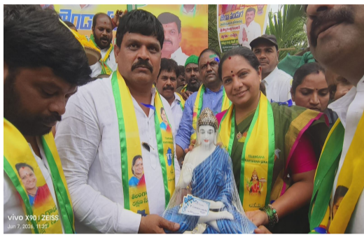
పటాన్చెరు, జూన్ 07: