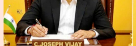
చెన్నై, జూన్ 07: ఢిల్లీలో జరగనున్న నిటి ఆయోగ్ సమావేశంలో పాల్గొననున్నట్లు సంబంధిత వర్గాలు ఆదివారం తెలిపాయి. ప్రధాని మోడీ అధ్యక్షతన జూన్ 11న న్యూఢిల్లీలో నిటి ఆయోగ్ సమావేశం జరగనుంది. ఈ సమావేశానికి అన్ని రాష్ట్రాలు, కేంద్రపాలిత ప్రాంతాల ముఖ్యమంత్రులు, లెఫ్టినెంట్ గవర్నర్లు హాజరుకానున్నారు. కేంద్రహోంమంత్రి అమిత్ షా, కాంగ్రెస్ పార్టీ సీనియర్ నేతలను

విజయ్ కలిసి అవకాశం ఉంది. ముఖ్యమంత్రి హోదాలో ఢిల్లీలో పర్యటించడం ఇది రెండవసారి. జాతీయ రాజధానిలో తన మొదటి పర్యటనలో విజయ్ ప్రధాని మోడీతో సమావేశమయ్యారు. రాష్ట్రవ్యాప్తంగా జల్ జీవన్ మిషన్ 2.0 (ఉయర్ సీర్ ఇయర్ క్యూ)ను అమలు చేసేందుకు తమిళనాడు ప్రభుత్వం, కేంద్ర ప్రభుత్వంతో ఈ నెల 2వ తేదీన ఒక అవగాహన ఒప్పందం (ఎంఓయూ) కుదుర్చుకున్న సంగతి తెలిసిందే. తమిళనాడు ముఖ్యమంత్రి, కేంద్ర జలశక్తి శాఖ మంత్రి సీ.ఆర్. పాటిల్ సమక్షంలో వీడియో కాన్ఫరెన్సింగ్ ద్వారా ఈ ఒప్పందంపై సంతకాలు జరిగాయి. ఈ పర్సనల్ సంతకాల కార్యక్రమంలో రాష్ట్ర, కేంద్ర ప్రభుత్వాల ఉన్నతాధికారులు పాల్గొన్నారు. తమిళనాడు వ్యాప్తంగా తాగునీటి మౌలిక సదుపాయాలను బలోపేతం చేయడానికి, గృహాలకు సురక్షితమైన, సరిపడా తాగునీటిని నిరంతరాయంగా అందించడానికి ఈ ఒప్పందం ఒక ముఖ్యమైన ముందుదశని అధికారిక ప్రకటన తెలిపింది.