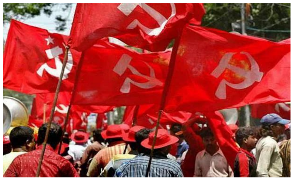
విద్యార్థులు, కార్మికులు, రైతులు

భర్తీ చేయడంలో ప్రభుత్వం విఫలమైందని, మరోవైపు ప్రభుత్వ రంగ సంస్థలను ప్రైవేటీకరణ పేరుతో బలహీనపరుస్తోందని విమర్శించారు. పెట్రోల్, డీజిల్, వంటకొవ్వు ధరలను విపరీతంగా పెంచడం వల్ల నిత్యావసర వస్తువుల ధరలు కూడా పెరిగి ప్రజల జీవనం భారంగా మారిందన్నారు. రైతులకు పంటలకు గిట్టుబాటు ధరలు లభించడం లేదని, వ్యవసాయ రంగం సంక్షోభంలో కూరుకుపోయిందని పేర్కొన్నారు. విద్యార్థులు, నిరుద్యోగ యువత భవిష్యత్తుతో కేంద్ర ప్రభుత్వం చెలాగటమాడుతోందని, వివిధ ప్రవేశ, ఉద్యోగ పరీక్షల్లో వరుసగా జరుగుతున్న పేపర్ లీకేజీలు పరీక్షా వ్యవస్థపై సమస్యను దెబ్బతీశాయని అన్నారు. లక్షలాది మంది విద్యార్థులు సంవత్సరాలపాటు శ్రమించి పరీక్షలకు సిద్ధమవుతుంటే, ప్రభుత్వ నిర్లక్ష్యం కారణంగా వారి భవిష్యత్తు ప్రమాదంలో పడుతోందని ఆవేదన వ్యక్తం చేశారు. కేంద్ర ప్రభుత్వం అమలు చేస్తున్న నాలుగు లేబర్ కోడ్లు కార్మికుల హక్కులను కాలరాస్తున్నాయని, ఎనిమిది గంటల పని విధానాన్ని బలహీనపరిచే ప్రయత్నాలు జరుగుతున్నాయని విమర్శించారు. కార్మికులు సాధించుకున్న హక్కులను కాపాడుకోవడానికి విస్తృత ఐక్య ధోరణులు అవసరమని అన్నారు.ప్రజల జీవన సమస్యలను పరిష్కరించడంలో విఫలమైన కేంద్ర ప్రభుత్వం మత విద్వేషాలను రెచ్చగొట్టి ప్రజలను విభజించే రాజకీయాలు చేస్తోందని విమర్శించారు. ప్రజల ఆనలు సమస్యలైన ఉపాధి, విద్య, వైద్యం, ధరల నియంత్రణ వంటి అంశాలపై దృష్టి సారించాలని డిమాండ్ చేశారు. సిపిఎం జిల్లా కార్యదర్శి టి అరుణ్ మాట్లాడుతూ ధరల పెరుగుదల, నిరుద్యోగం, పేపర్ లీకేజీలు, కార్మిక వ్యతిరేక విధానాలు, ప్రజా రంగ సంస్థల ప్రైవేటీకరణకు వ్యతిరేకంగా జూన్ 9న నిర్వహించే నిరసన కార్యక్రమాలలో ప్రజలు, యువత,