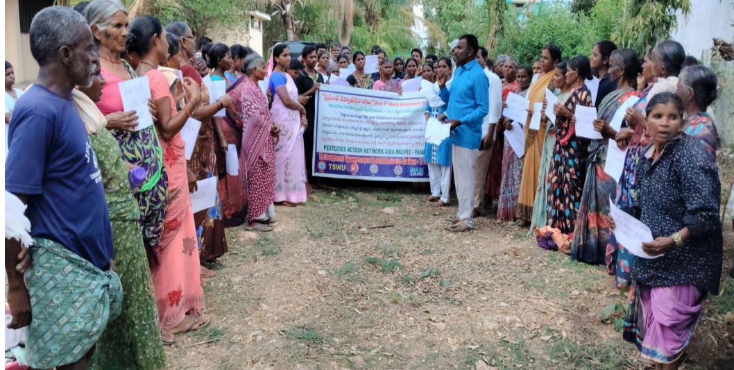
ఇవ్వాలి జీవన విధానాలతో బ్యాటరీ తో నడిపే వాహనాలను వెంటనే ప్రవేశపెట్టాలి గ్యాస్ వెలికితీత ఆపాలన్నారు. ప్లాస్టిక్ బ్యాగుల వాడకాన్ని నిషేధించి పర్యవేక్షించాలి పట్టణాల్లో

పంచాయతీల్లో చెత్తను డంపింగ్ యార్డ్ లో నిలవ చేయకుండా రీసైకింగ్ చెయ్యాలన్నారు. వ్యవసాయంలో రసాయన ఎరువులు పురుగుమందులు నిషేధించాలి జీవన ఎరువులు జీవనం మందులు ప్రోత్సహించాలన్నారు. సేంద్రీయ ఎరువులను వాడాలి ప్రకృతి వ్యవసాయాన్ని ప్రోత్సహించాలి ఆహార సర్వభౌమత్వాన్ని కాపాడాలి రిజర్వు ఫారెస్టులను సంరక్షించాలన్నారు. సామాజిక అడవులను ప్రోత్సహించాలి పిల్లల హక్కులకు భంగం కలగకుండా అన్ని జాగ్రత్తలు తీసుకోవాలన్నారు. పాఠశాల వరసలలో ఎలాంటి పరిశ్రామికులు ఉండకూడదను అధికంగా మొక్కలు నాటాలన్నారు. పాఠశాలకు రెండు కిలోమీటర్ల పరిధిలో రసాయన ఎరువులు పురుగుమందులు చల్లడం గానీ పండ్లలోను ఏర్పాటు చేయాలన్నారు. పిల్లలకు సౌభాషారం అందజేయాలి బడిలో పరిశుభ్రమైన గదులు త్రాగునీరు తరచూ చేతులు శుభ్రం చేసుకొని దానికి ఏర్పాటు శుభ్రమైన మరుగుదొడ్లు ఉండాలన్నారు. తుఫాన్ లో అంటి ప్రకృతి వివత్తుల సమయంలో ముందుగా పిల్లలను సంరక్షితమైన సౌకర్యవంతమైన ప్రాంతంలో ఉంచాలన్నారు. ఎండ తీవ్రతపై