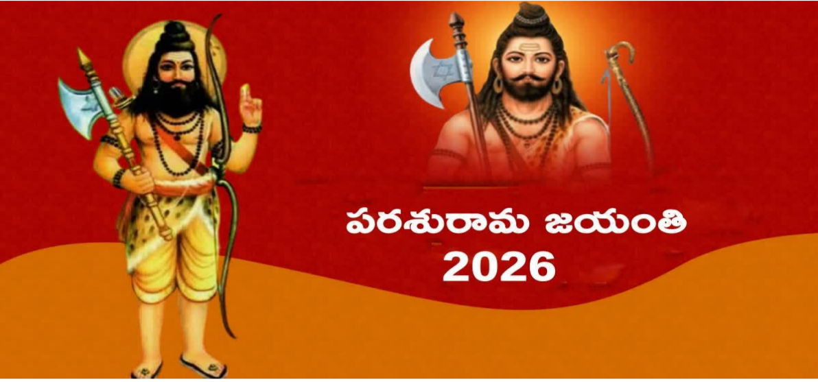
పరశురామ జయంతి 2026

శ్రీ మహావిష్ణువు దశావతారాల్లో పరశురామావతారం కూడా ఒకటి. పరశురాముడు శ్రీమహావిష్ణువు ఆరో అవతారం అని చెబుతారు. పరశు అంటే గొడ్డలి. పరశురాముడు శివుని గురించి ఘోరమైన తపస్సు చేసి శివుని నుంచి అఖండ గొడ్డలిని పరంగా పొంది, దుష్టశిక్షణ చేసేనట్లు పురాణాలు చెబుతున్నాయి. వైశాఖ శుద్ధ తదియ పరశురామ జయంతి సందర్భంగా ఆ మహాసభావుని గురించి కొన్ని విశేషాలు ఈ కథనంలో తెలుసుకుందాం.