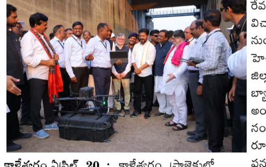
కాళేశ్వరం, ఏప్రిల్ 20 : కాళేశ్వరం ప్రాజెక్టులో జరిగిన అవినీతిపై సీబిఐ విచారణకు రాష్ట్ర శాసనసభ తీర్మానం చేసి పంపినా, కేంద్రప్రభుత్వం స్పందించడంలేదని సీఎం ఏ

రేవంత్ రెడ్డి అన్నారు. కేంద్రం తక్షణం సీబిఐ విచారణకు ఆదేశించకపోతే కాళేశ్వరం నుంచే ఆందోళన ప్రారంభిస్తామని హెచ్చరించారు. సోమవారం భూపాలపల్లి జిల్లా కాలూరం మండలంలోని మేడిగడ్డ బ్యారేజీని ఆయన సందర్శించారు. అంతకుముందు కాళేశ్వరం దేవాలయాన్ని సందర్శించి పూజలు నిర్వహించారు. రూ.198 కోట్లతో ఆలయ అభివృద్ధి పనులకు శంకుస్థాపన చేశారు. మేడిగడ్డ బ్యారేజీని సందర్శించిన నేపథ్యంలో నేషనల్ డ్యాం సీస్టి ఏజెన్సీ, తదితర కేంద్ర ఏజెన్సీ ప్రతినిధుల సమక్షంలో ప్రాజెక్టులో