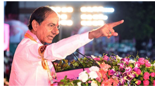
జగిత్యాల, ఏప్రిల్ 20 : గ్రామ పంచాయతీలను నాశనం పట్టించారని.. మున్సి పాలిటీలను మురికి కూపం పట్టించారని కాంగ్రెస్ పాలనపై బీఆర్ఎస్ అధినేత కేసీఆర్ మండిపడ్డారు. మరి ఏం సక్రమందని ప్రశ్నించారు. అందుకే కాంగ్రెస్ పోవాలి.. బీఆర్ఎస్ రావాలి అని జీవన్ రెడ్డి వంటి సీనియర్ నాయకులు అంటున్నారని తెలిపారు. వాళ్ల నోటి నుంచి వట్టిగానే ఆ మాట వస్తూ.. బాధ్యత లేకుండానే వస్తూ అని ప్రశ్నించారు. ఏం చూసినా సక్రమం లేకపోతే.. పొద్దున లేస్తే దోపిడి తప్ప ఇంకోటి లేకపోతే ఎందుకు ఈ పరిస్థితి వస్తుందని అడిగారు. రాష్ట్ర

ఆర్థిక పరిస్థితి నాశనం.. ఉద్యోగస్థులు ఆగం.. రిటైర్డ్ ఉద్యోగస్థులు ఆగం.. విద్యార్థుల జీవితం ఆగం.. ఆటో కార్మికుల జీవితాలు ఆగం.. ఎవరు సక్రమం న్నరు అని కేసీఆర్ అడిగారు. సంప్రదించి ఎవరు న్నారని అన్నారు. ఈ అందానికి బోడి ముంద హైద్రాబాద్ తీసుకొచ్చారని ఎద్దేవా చేశారు. హైదరాబాద్లో హైద్రా ఉందని.. నిజామా బాద్కు నిద్రా తీసుకొస్తామని పీసీసీ ప్రెసిడెంట్ ఒకరు చెబుతున్నారని మండిపడ్డారు.