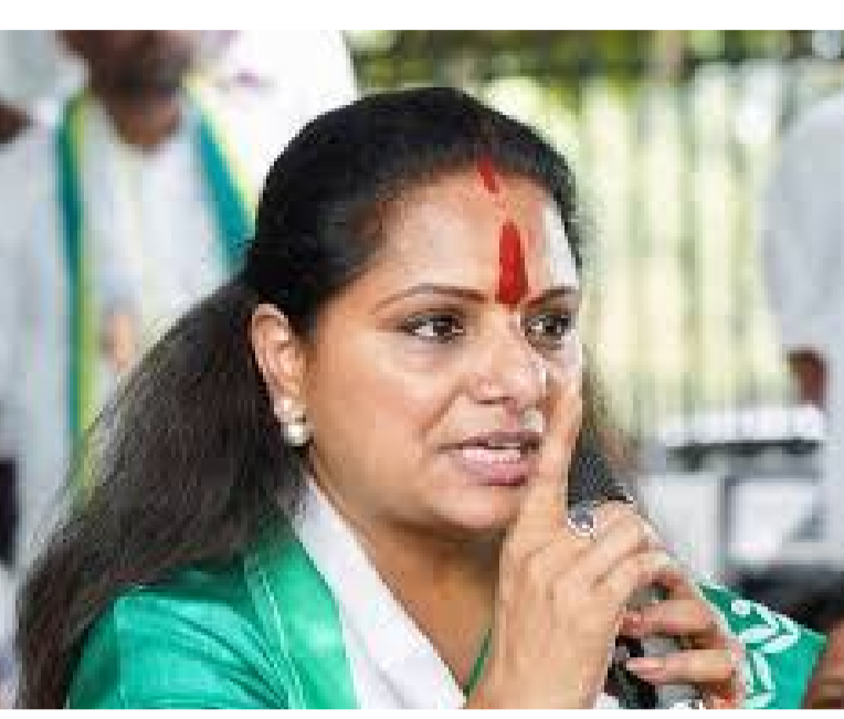
గెలుచుకొని కేంద్రంలో చక్రం తిప్పుతానని కేసీఆర్ పెద్ద ఎత్తున ప్రచారం చేసుకున్నారు. ఇతర ప్రాంతీయ పార్టీల నాయకులను కలిసి తనకుతాను అతిపెద్ద నాయకుడిగా ఉహించుకున్నారు. జాతీయ రాజకీయాల పేరుతో నేల విడిచి సాము చేసిన కెసిఆర్ బొక్కబోర్లా వడ్డారు. తెలంగాణను బాగుచేయకుండా, అవినీతికి గేట్లు తెరిచి, జాతీయ రాజకీయాలు అంటూ కేసీఆర్ ఊరేగడాన్ని తెలంగాణ సమాజం కూడా హర్షించలేదు. ఫలితంగానే 2023లో కెసిఆర్ ఓడించారు. పార్టీలో సమష్టి నిర్ణయాలు, అలోచనలకు

కూడా ఇదే గతి వదుతుంది. ఇకపోతే అవర చాణక్యుడిగా పేరొందిన కేసీఆర్ 2023 ఎన్నికల్లో ఓడిపోయాక కనసీం అసెంబ్లీకి రావడం లేదు. ప్రజల్లోకి రావడం లేదు. రంచనగా జీతాలు మాత్రం పొందుతున్నారు. ఈ క్రమంలో పార్టీ పేరును మళ్లీ తెలంగాణ రాష్ట్ర సమితిగా మార్చే విషయం పరిశీలిస్తున్నామని ఆ పార్టీ వర్కింగ్ ప్రెసిడెంట్ కేసీఆర్ చెప్పుకొచ్చారు. బిఆర్ఎస్ ను బిఆర్ఎస్ గా మార్చాలనుకున్నప్పుడు అది సరైన నిర్ణయం కాదని వచ్చిన విమర్శలను పట్టించుకోలేదు. నరికడా జాతీయ పార్టీగా ప్రకటించి పలు రాష్ట్రాల్లో ఊరేగారు. తెలంగాణ రాష్ట్ర సమితిని భారత రాష్ట్ర సమితిగా మార్చాలనుకోవడం ఆత్మహత్యానందం అవుతుందని వచ్చిన హెచ్చరికలను పెడచెవిని పెట్టారు. తెలంగాణ అన్న పేరుకు దూరమవడం తెలివి తక్కువ నిర్ణయమని గుర్తించలేకపోయారు. పార్టీలోని మెజారిటీ నాయకులు కూడా ఇదే అభిప్రాయంతో ఉండేవారు. అయితే ఎవరూ నోరు విప్పడానికి సాహసించలేకపోయారు. భిన్నాభిప్రాయాలను కేసీఆర్ ప్రోత్సహించేవారు కాదు. ఎవరు కూడా ఆయన నిర్ణయాలను నిలదీసే ధైర్యం చేసేవారు కాదు. ఇది పార్టీలో ప్రజాస్వామ్యం లేదనడానికి నిదర్శనం. కెసిఆర్ చెప్పిందే వేదం అన్నట్లుగా పార్టీ నడిచింది. ప్రాంతీయ పార్టీల్లో ఇది సహజమే అయినా అలోచనలను పంపకోవాలి. కేసీఆర్ అవర చాణక్యుడని, అనేక తెలివితేటలు ఉన్నాయని, ఆయన చేసే రాజకీయ అత్యుద్దేశాలు తిరుగుండదని, ఆయన ఎలా చెబితే అలాగే జరుగు తుందని నమ్మే స్థితికి పార్టీ నేతలు వచ్చారు. ఈ కారణంగానే తెలంగాణ రాష్ట్ర సమితిని జాతీయ పార్టీగా విస్తరించి భారత రాష్ట్ర సమితి పేరిట ఇతర రాష్ట్రాల్లో కూడా పోటీ చేసే తగినన్ని సీట్లు