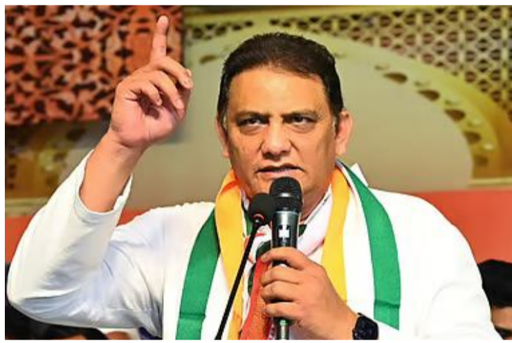
ఈలోగా ఎమ్మెల్యేగా గవర్నర్ ఆమోదించాలి సీఎం చివరితో గవర్నర్ ఆమోదంస్తారా అన్న ఉత్కంఠ