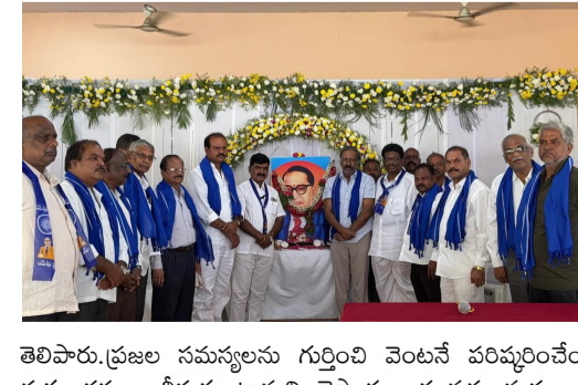
తెలిపారు. ప్రజల సమస్యలను గుర్తించి వెంటనే పరిష్కరించేందుకు చర్యలు తీసుకుంటామని చెప్పారు. యువత, వృద్ధులు, మహిళల సంక్షేమం కోసం ప్రత్యేక కార్యక్రమాలు చేపడతామని వెల్లడించారు. ప్రాంత ప్రజలు కూడా ఈ ఐక్యతను స్వీకరిస్తూ, నాయకుల నుండి మరింత అభివృద్ధి ఆశిస్తున్నట్లు తెలిపారు.