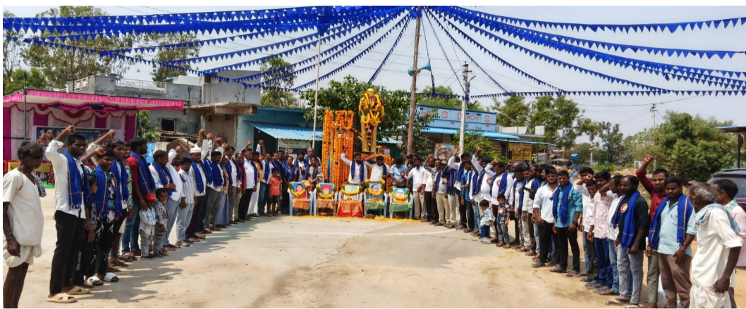
భాషాసాహెబ్ అంబేద్కర్ యావత్ ప్రపంచానికి స్ఫూర్తి ప్రదాత అని మాజీ ఎమ్మెల్యే పేర్కొన్నారు.